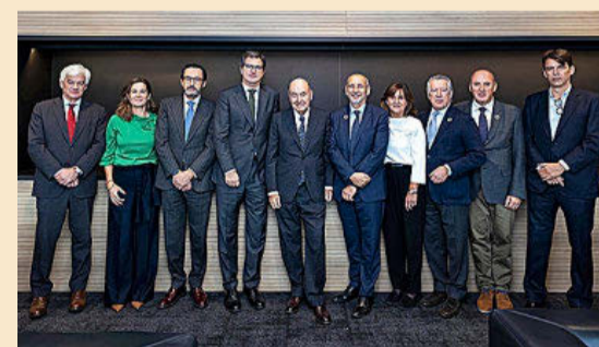
Imagen del día de la firma del acuerdo.

Taylor Wessing y Ecija cerraron su alianza estratégica el pasado mes de marzo. El acuerdo supone el aterrizaje de un despacho 'top 20' en Reino Unido en España de la mano de la firma presidida por Hugo Écija. El acuerdo ha dado como resultado una red combinada de más de 3.000 profesionales y 500 socios presentes en 62 oficinas repartidas por 32 jurisdicciones de todo el mundo.